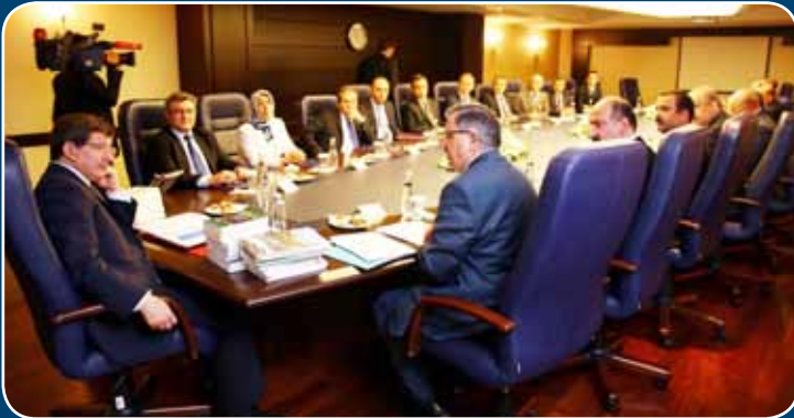
Başbakan Davutoğlu ile Görüştük