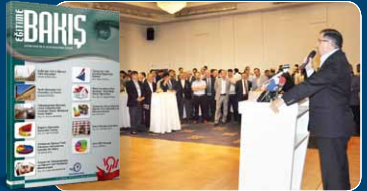
Eğitime Bakış'ın Yazarlarını Buluşturduk